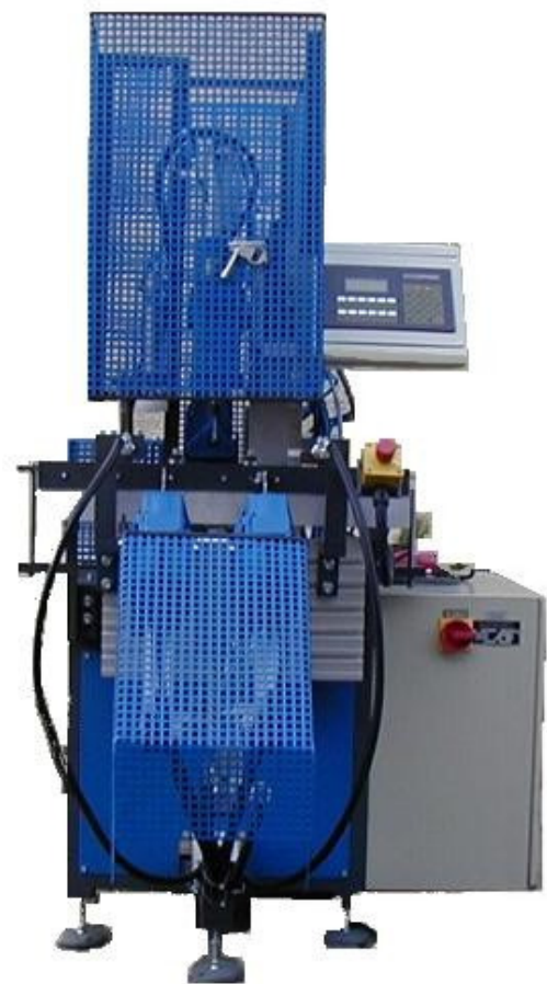
Abbildung Vorderansicht: (Figure front)